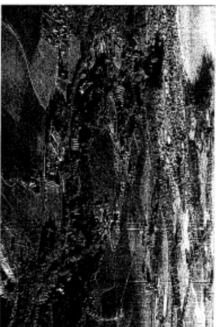
RD 786 – RD 21 Aménagements entre Pordic, Binlic, Étables-sur-Mer et Saint-Quay-Portrieux